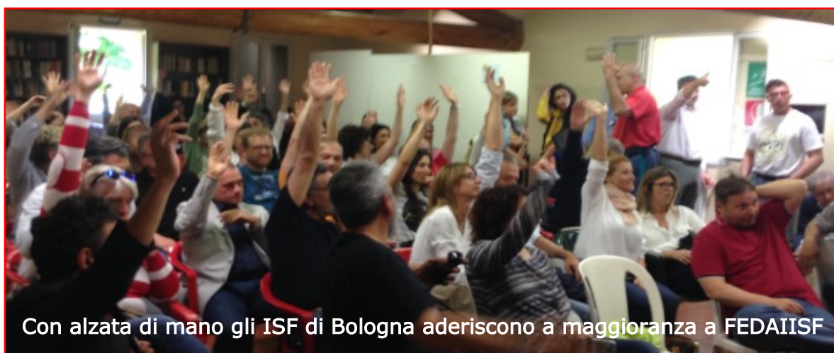
Con alzata di mano gli ISF di Bologna aderiscono a maggioranza a FEDAIISF

All'apertura dell'Assemblea degli ISF di Bologna, tenutasi il 12 maggio scorso, si è affermata la necessità che FEDAIISF, e le OOSS, facciano, ognuno per le proprie competenze, da interlocutori qualificati in rappresentanza degli ISF presso le istituzioni regionali. Soprattutto ora che stiamo assistendo a una sistematica metodica per ridurre drasticamente l'accesso degli ISF, agenti, venditori e tutti coloro che lavorano nel settore (nessuno escluso), nelle strutture pubbliche, che siano ospedali o poliambulatori Ausl. I relatori hanno aggiornato e fatto il punto degli incontri che il sindacato e FEDAIISF hanno effettuato con le autorità regionali proprio sulla revisione del Regolamento Regionale 2309 del 2016 per l' informazione scientifica estremamente penalizzante per gli ISF, tanto da mettere a serio rischio il posto di lavoro. Nel dibattito che ne è seguito si è evidenziata la consapevolezza che non è più tempo di individualismi e che bisogna unirsi. La riunione si è conclusa dopo tre ore di intenso e animato dibattito e dopo che, per alzata di mano, i presenti hanno deciso a maggioranza di aderire a FEDAIISF.